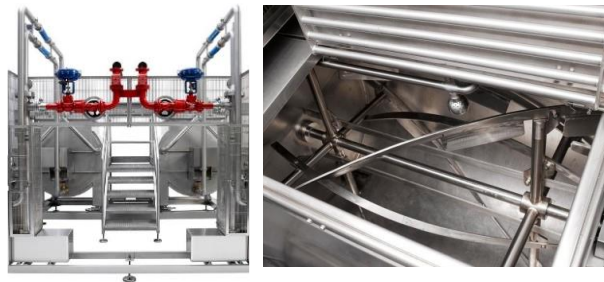
Tanques de preparación y mezcla

Mediante una permanente interacción con la industria y nuestros clientes, en STV somos capaces de ofrecer un servicio de asesoramiento útil para la organización interna de la empresa, generando una mejora constante de la calidad de los servicios, soportado por nuestro personal técnico que identifica en sitio las necesidades de cada cliente.