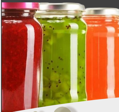
Túnel de tratamiento térmico para productos envasados