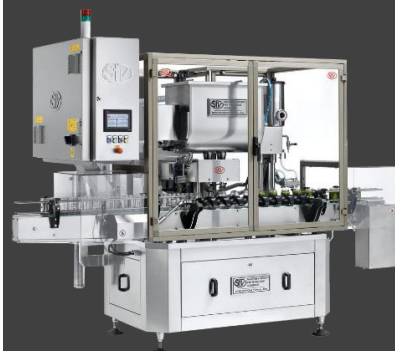
Sopladores de aire/vapor