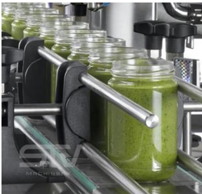
Tanques de desalinización