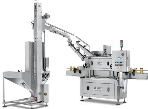
Cerradora automática lineal para tapa Twist off

Es por lo que nuestro equipo técnico, cuenta con una amplia experiencia en la gestión de soluciones personalizadas, optimizando el presupuesto que nuestro cliente puede invertir en su proyecto.